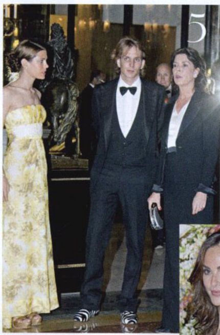
Gala Amade A Montecarlo Il giusto scopo

Come ogni rock-star che si rispetti, anche Justin Bieber, a soli 17 anni e 6 milioni di dischi venduti (in un anno o poco più), ha concluso l'unica data italiana del suo tour con una festa privatissima, ospite degli amici Dolce & Gabbana al Gold di Milano. Fuori, centinaia di fans. Dentro, la sua playlist preferita (da Kayne West a Chris Brown) per ballare fino a notte fonda.